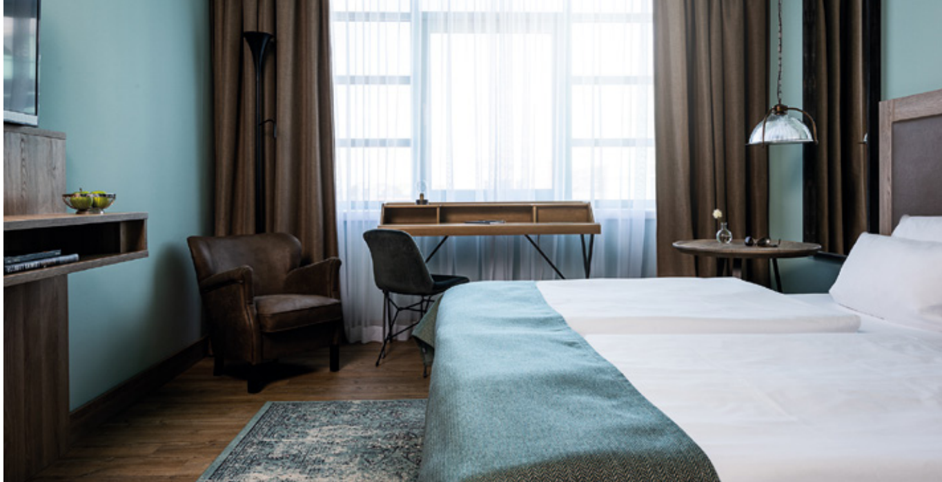
Modernes Industrie-Design in einem unserer 137 Standard-Zimmer.